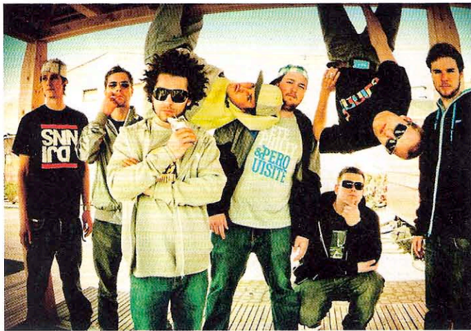
Funkrap vom Allerfeinsten: DICKES B

Veranstaltung für die ganze Familie. So bietet die Dorfgemeinschaft Weiß an beiden Tagen ein umfangreiches und betreutes Kinderprogramm an in einem Zelt mit Circus Manege und auf dem Gelände des Jugendzentrums. Shows, Artistik zum Lernen und Mitmachen, diverse Spielstationen mit tollen Attraktionen werden die Kleinen und ihre Eltern begeistern. Damit die Jüngsten sich zwischendurch stärken können, haben die Veranstalter für sie Kakao, Kaffee und Kuchen und Gegrilltes im Angebot.